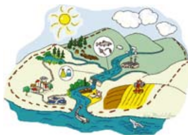
Figure 1 Représentation artistique d'un bassin-versant

durable des forêts privées. Bien plus qu'une tendance, cette façon de faire s'inscrit déjà comme une condition au sein des indicateurs de plusieurs normes de certification des pratiques forestières. En forêt privée, l'utilisation du sous-bassin comme unité de planification s'avère intéressante pour implanter un processus de gestion qui dépasse les limites des petites propriétés individuelles. D'une part, cette approche facilite le regroupement de lots où les propriétaires peuvent facilement s'identifier et développer un sentiment d'appartenance à un territoire qui n'est pas trop vaste. D'autre part, elle permet d'obtenir une vision globale pour établir une stratégie commune de développement durable