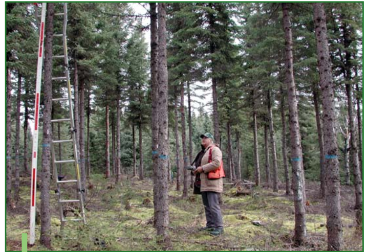
Plantation un peu moins dense (densité de 2 750 plants/ha) sur une station peu fertile (IQS=6 m) éclaircie à 36 ans.

au moment où la surface terrière tend vers la limite inférieure proposée. Une autre solution consiste à couper ces tiges encore plus tôt lors d'une éclaircie pré-commerciale. Cette alternative est particulièrement intéressante pour les propriétaires intéressés à travailler dans leurs plantations. L'éclaircie permet d'atténuer l'importance des tiges déformées ou de peu de valeur en les éliminant et en répartissant le potentiel de croissance de la station sur les plus belles tiges, soit celles qui auront la plus grande valeur lors des coupes subséquentes. Toutefois, si le nombre de tiges déformées est trop important, il faut évaluer s'il y a suffisamment de belles tiges pour justifier les investissements liés à une éclaircie.