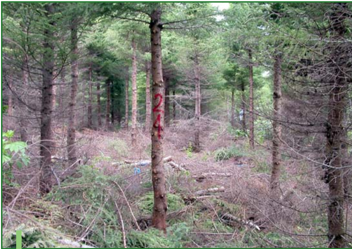
Plantation très dense (densité de 4 444 plants/ha) sur une station très fertile (IQS=10 m) éclaircie à 17 ans.

Notez les différences de caractéristiques de plantations et leurs influences sur l'âge d'intervention.