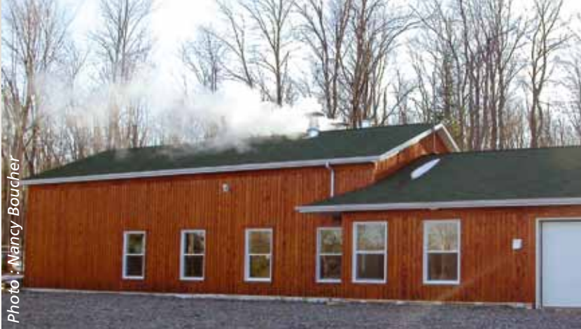
L'Érablière-École de Saint-Romain où ont lieu la plupart des cours pratiques.

La formation en production acéricole est essentiellement pratique et la plupart des cours ont lieu à l'extérieur et à l'Érablière-École. L'Érablière-École est située à Saint-Romain sur terre publique. Il s'agit d'un lieu unique où les élèves ont le privilège de recevoir la formation pratique. L'Érablière-École compte 15 000 entailles et les élèves ont la chance de travailler avec des équipements à la fine pointe de la technologie. La production du sirop d'érable de l'Érablière-École est certifiée biologique. À l'intérieur, on y retrouve une salle de classe, facilitant ainsi la transition des cours théorique et pratique.