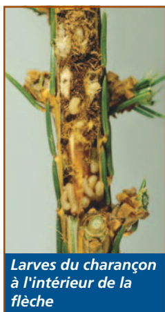
Larves du charançon à l'intérieur de la flèche

Le charançon du pin blanc a comme hôte principal l'épinette de Norvège, suivie du pin blanc. C'est un coléoptère (5 mm de long) indigène en Amérique du Nord et qui n'a qu'une génération par année.