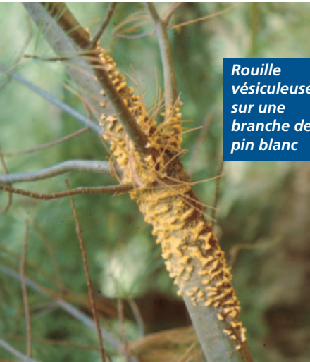
Rouille vésiculeuse sur une branche de pin blanc

La rouille vésiculeuse du pin blanc est causée par un champignon pathogène : Cronartium ribicola . Cette maladie, introduite en Amérique du Nord au début du siècle dernier, a été détectée pour la première fois au Québec en 1916.