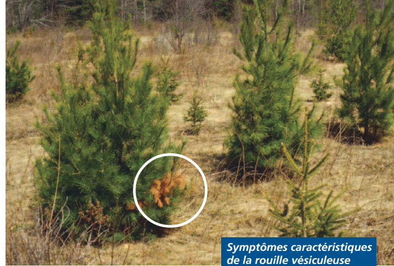
Symptômes caractéristiques de la rouille vésiculeuse

Une fois la plantation établie sur un site adéquat, l'élagage systématique devrait par la suite contrer la progression de la maladie dans la plantation. L'élagage systématique est la coupe de toutes les branches, malades ou saines, sur une hauteur prescrite par le conseiller forestier. Cette opération permet aussi d'enlever les branches susceptibles d'être attaquées par la maladie. De plus, en élaguant le tronc des arbres, la qualité de la bille pour le sciage est améliorée. L'élagage systématique peut se faire en tout temps, sauf par période de grands froids et doit se faire avec précaution durant la saison de la sève (printemps). Enfin, comme l'infection ne se transmet pas d'un pin à un autre, toutes les branches coupées peuvent être laissées sur place, sans risque d'infection pour les autres pins blancs.