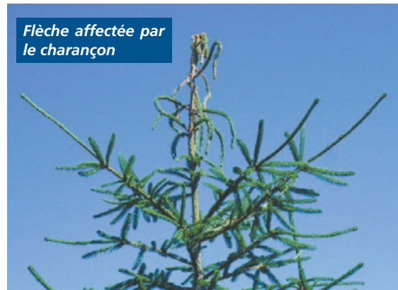
Flèche affectée par le charançon

Une population de charançons qui migre dans une nouvelle plantation évolue lentement pendant les cinq ou six premières années puis elle augmente rapidement par la suite. Il importe donc de surveiller les jeunes plantations pour mieux contrôler le charançon et en minimiser l'impact.