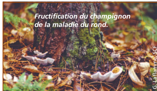
Fructification du champignon de la maladie du rond.

Observée en Ontario pour la première fois en 1955 dans des plantations de pins rouges éclaircies dix ans auparavant, la maladie du rond a été détectée au Québec en 1989 dans une plantation de pins rouges. En raison de l'importance des dégâts causés dans le monde, elle compte parmi les maladies les plus dévastatrices des forêts résineuses. La maladie du rond affecte plus de 170 espèces d'arbres, résineux et feuillus, les conifères étant les plus atteints.