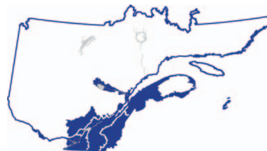
Territoires où les résultats s'appliquent.

Dans notre étude, le compartiment arbres comprend la partie aérienne pour l'épinette blanche et la partie aérienne et les racines pour le pin rouge. Les arbres constituent le principal puits de CO 2 des plantations, accumulant 40 et 37 tonnes de C ha -1 en 22 ans pour l'épinette blanche et le pin rouge respectivement, ce qui égale environ la moitié du C accumulé à 50 et 40 ans. Dans le cas de l'épinette blanche, l'accumulation du C dans les arbres (+40 tonnes de C ha -1 ) est supérieure à celle de l'ensemble de la plantation (+12 tonnes de C ha -1 ), car le sol est une source de CO 2 .