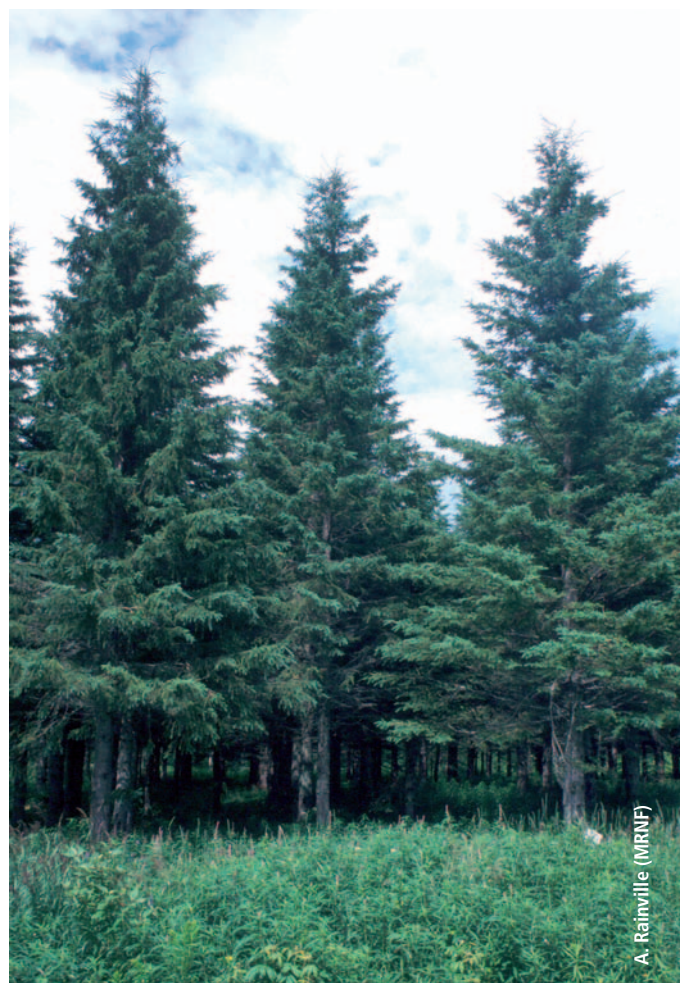
Plantation d'épinette blanche de 30 ans à Lac Saint-Ignace.