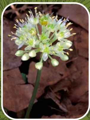
Fleur d'ail des bois Thomas G. Barnes