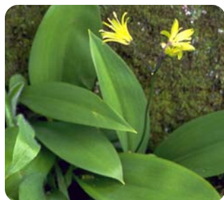
Clintonie boréale À ne pas confondre Thomas G. Barnes

Gouvernement du Québec, La chronique environnementale, l'ail des bois toujours sous surveillance , [en ligne] www.mddep.gouv.qc.ca/chronique/2000/mars-juillet/000518_ail.htm (consulté le 26 avril 2006)