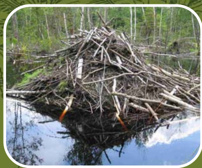
Hutte de castor L.Letarte