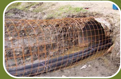
Grillage à ponceau