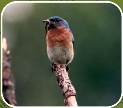
Merlebleu de l'Est J. Lehoux

Le merlebleu de l'est est un petit oiseau magnifique. Son plumage bleu et sa poitrine rousse en font un visiteur très prisé des amateurs d'oiseaux. Les populations de merlebleu ont subi un déclin important au milieu du siècle en partie à cause de la perte d'habitat et de la compétition avec le moineau domestique et l'étourneau sansonnet. Depuis plus d'une vingtaine d'années, les ornithologues ont réussi, grâce à la construction et l'installation de nombreux nidoirs, à faire augmenter les populations de merlebleu de l'est. Voici un plan pour la réalisation d'un nidoir à merlebleu que vous pourrez installer sur votre propriété.